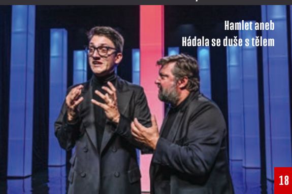
Hamlet aneb Hádala se duše s tělem