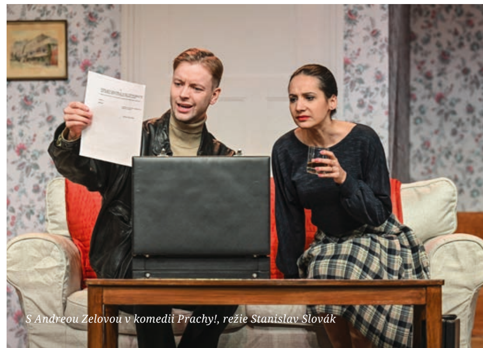
S Andreou Zelovou v komedii Prachy! , režie Stanislav Slovák

Takhle jsem o tom nepřemýšlel, ale je pravda, že cestou zpátky jsem letěl přes Isfahán, a tak jsem na Roba myslel. (úsměv) Podobné je, že i Rob se bezhlavě vydává do něčeho, co neví, jak dopadne a jestli vše zvládne. I já se na konkurz přihlásil s nadšením po hlavě a nepřemýšlel nad důsledkem. V průběhu jsem potom měl pár temných chvil, kdy jsem si říkal, že jsem se přecenil, že nejsem schopen doučit se posledních několik stránek v angličtině, protože se na mě valí hromada režijních připomínek a najednou je potřeba mít i správný akcent a výslovnost. I Rob má během cesty pár podobných momentů, kdy si říká, že to nezvládne. Odpověď tkví v tom, že když člověk věří sám v sebe, neuhne a jde za svým srdcem, za tím, co upřímně cítí, že má rád a v co věří, je schopen dosáhnout čehokoliv, co by si ani nepředstavil, že by dokázal. Kdyby mi někdo před rokem řekl, že příští léto budu tři měsíce v Číně hrát THRILL ME v angličtině s kluky z newyorské Broadwaye, řekl bych si, že jde o dobrý fór.