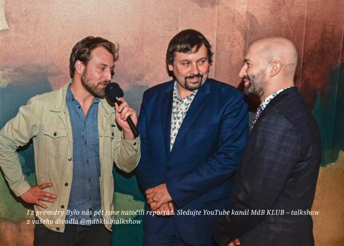
I z premiéry Bylo nás pět jsme natočili reportáž. Sledujte YouTube kanál MdB KLUB – talkshow z vašeho divadla @mdbklubtalkshow