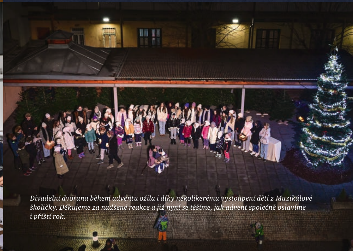
Divadelní dvorana během adventu ožila i díky několikerému vystoupení dětí z Muzikálové školičky. Děkujeme za nadšené reakce a již nyní se těšíme, jak advent společně oslavíme i příští rok.